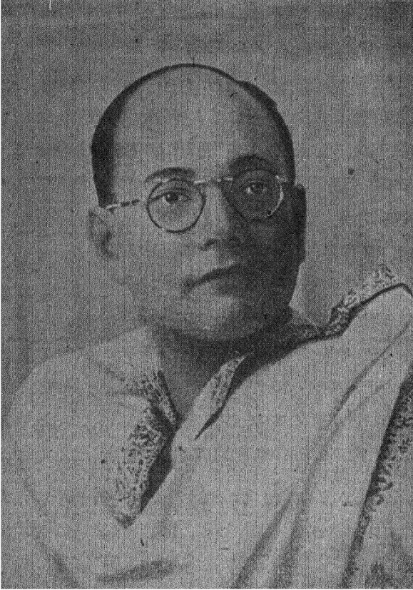
मृत्युञ्जय सुभाष बोस